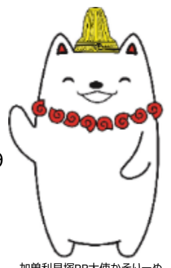
加曾利貝塚PR大使がそりーぬ